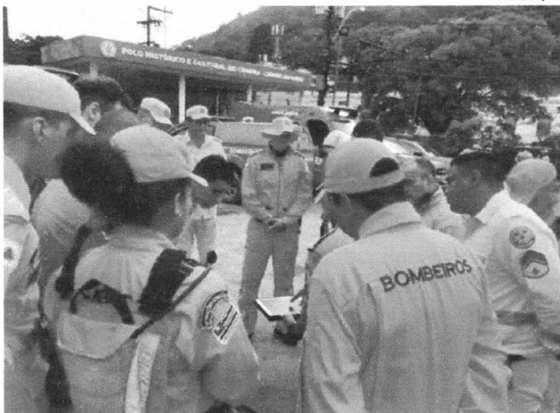
Bombeiros do Maranhão se integraram a militares de vários estados do Brasil nas operações de busca em Petrópolis

Segundo o Corpo de Bombeiros Militar do Rio de Janeiro (CBMRJ), também estão trabalhando na operação de resgate militares de Santa Catarina, Rio Grande do Sul, Paraná, Tocantins, Goiás, Mato Grosso, Ceará, Sergipe, Paraíba, Alagoas, Bahia, São Paulo, Minas Gerais, Espírito Santo e do Distrito Federal. Ainda segundo o CBMRJ, mais de 180 óbitos decorrentes da tragédia já foram registrados – o maior da história da cidade – e 104 pessoas ainda estão desaparecidas. Nas redes sociais, o governador Flávio Dino informou que a equipe do CBMMA permanecerá em Petrópolis “enquanto houver necessidade”. Na sexta-feira (18), Dino já havia compartilhado vídeo que registra o momento em que o piloto da aeronave que levava os binômios do CBMMA à Petrópolis, saúda os voluntários